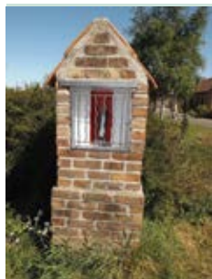
Notre-Dame de la Paix, rénovée rue Vigneron à La Chapelle d'Armentières.