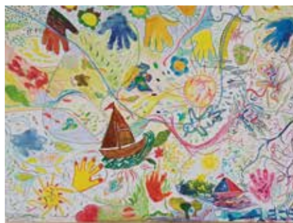
Réalisation de la fresque collective de la Mission ouvrière sur le thème « Cultivons l'Espérance » le 5 mai 2025.