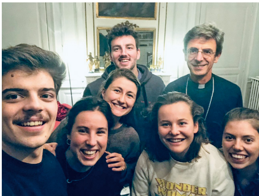
M GR PIERRE-ANTOINE BOZO, ÉVÊQUE DE LIMOGES

Il ne s'agissait pas de vacances à la campagne, plutôt d'un pari fou : confiner ensemble des jeunes qui pour la plupart ne se connaissent pas, dans des paroisses plutôt isolées avec une vie communautaire exigeante, et disponibles pour rendre service en dehors de leur travail. Maraudes, visites aux personnes seules, distribution de colis alimentaires, chantiers peinture, réparations, vidéos, ani-