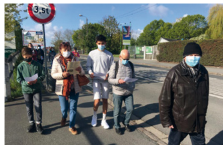
Des pèlerins cheminent vers Saint-Joseph.

La Mission ouvrière a organisé un partage sur «le sens du travail aujourd'hui» et ce qu'il signifie concrètement pour les familles. De nos jours, elle coordonne les actions de l'évangélisation dans le milieu ouvrier et les quartiers populaires. Les communautés de fidèles du monde entier continueront d'invoquer saint Joseph au cours de cette année 2021 «si spéciale» et jusqu'au 8 décembre.