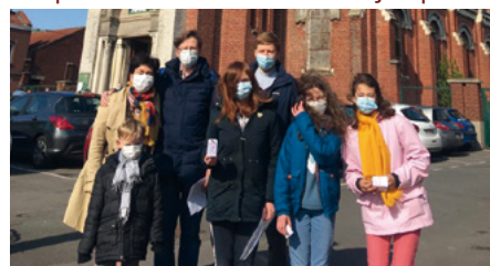
Arrivée de pèlerins à Saint-Joseph du Bizet.