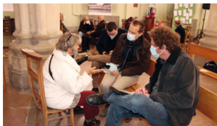
Avec la mission ouvrière, réflexion sur le partage sur le travail aujourd'hui.

Nous avons voulu retrouver l'effort du pèlerin vers le lieu saint : petits groupes partant de Saint-Louis ou Saint-Vaast vers Saint-Joseph, but de la rencontre et de la célébration commune.