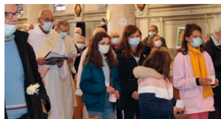
Messe à Saint-Joseph du Bizet avec la Mission ouvrière.

Mettons-nous cette année, sans hésiter, à l'école de saint Joseph !